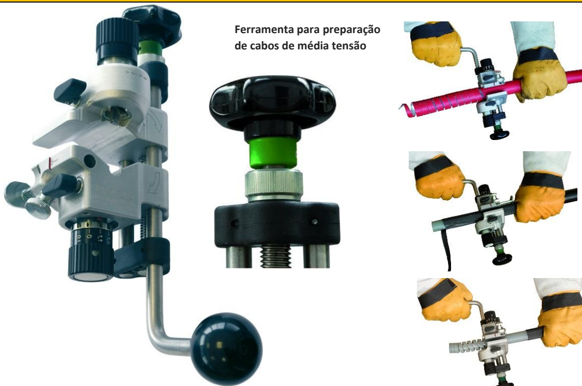
Ferramenta para preparação de cabos de média tensão